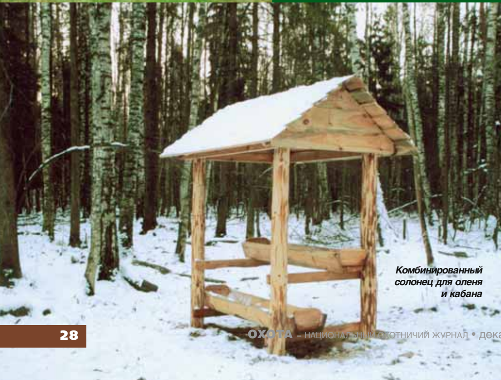
Комбинированный солонец для оленя и кабана

В настоящее время уже в трех хозяйствах Союза проведены семинары по повышению квалификации егерей и охо-