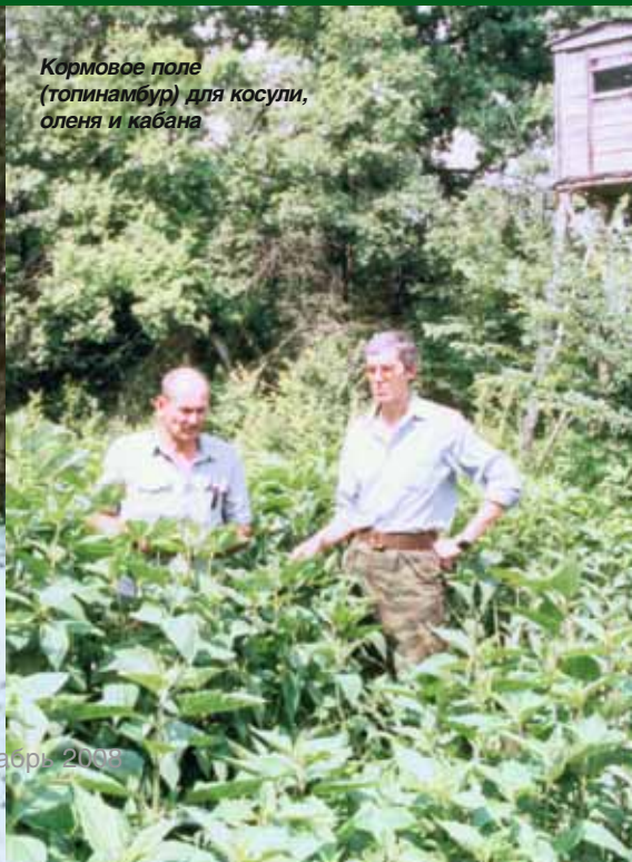
Кормовое поле (топинамбур) для косули, оленя и кабана