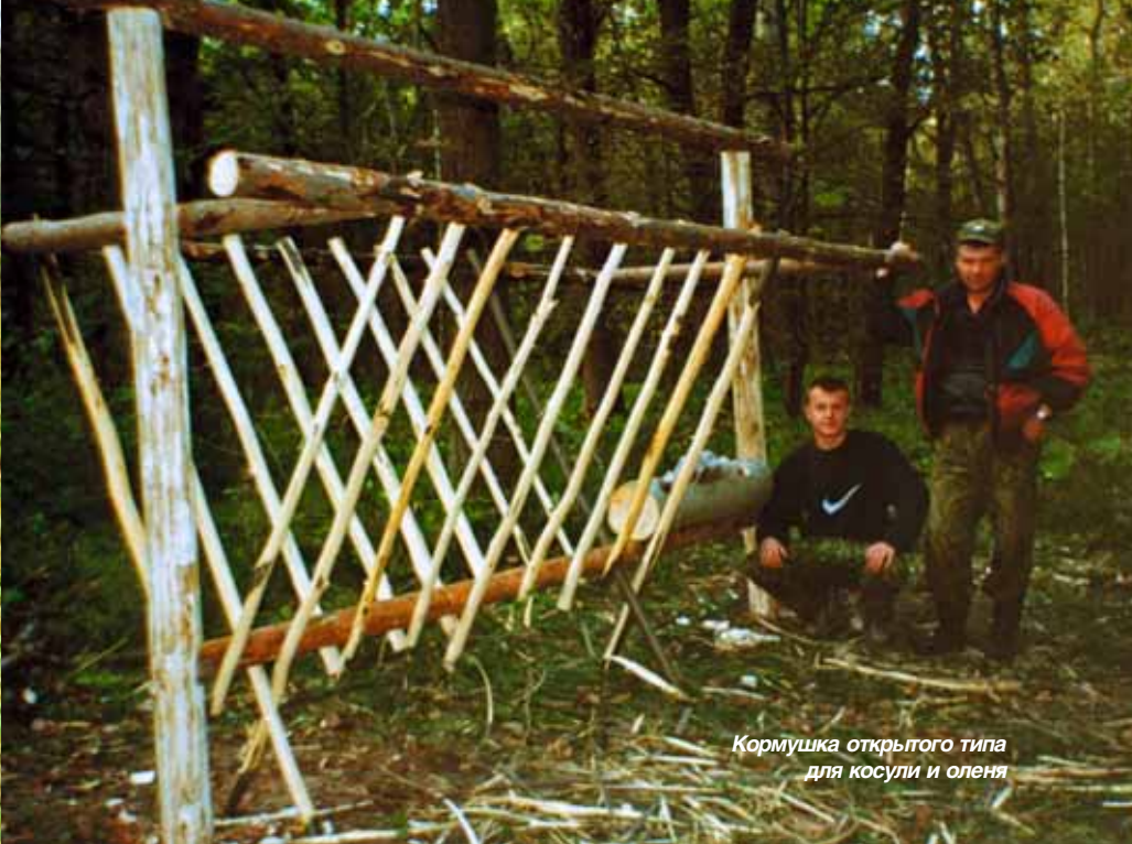
Кормушка открытого типа для косули и оленя

товедов, а в двух из них проведены курсы по экспертизе охотничьих трофеев и селекционной работе. В наших планах проведение совещаний-семинаров с директорами наших охотничьих хозяйств в лучших охотничьих хозяйствах Союза. Все наши директора и охотоведы будут приглашены для обмена опытом и участия в деловой программе на специализированную выставку «Охотничий мир России – 2009», которую Союз будет проводить в Белгороде со 2 по 4 апреля.