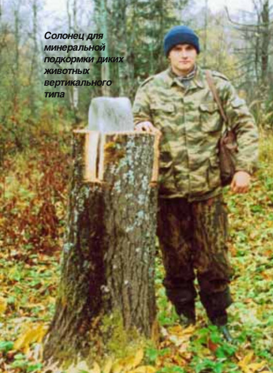
Солонец для минеральной подкормки диких животных вертикального типа