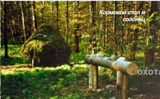
Кормовой стол и солонец