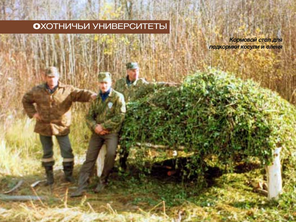
Кормовой стол для подкормки косули и оленя