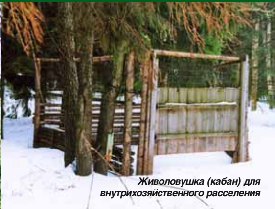
Живоловушка (кабан) для внутрихозяйственного расселения