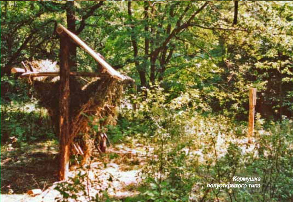
Кормушка полукрытого типа