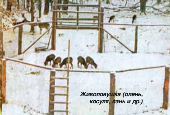
Живолушка (олень, косуля, лань и др.)