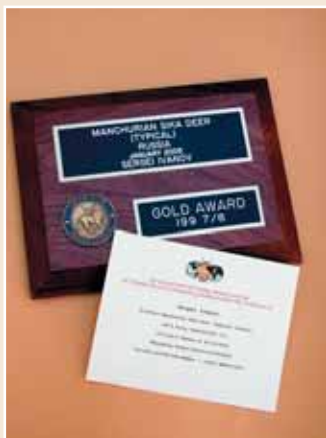
Трофей и награда 2006 года

Ни пуха Вам, ни пера! И новых рекордных трофеев! 🐾